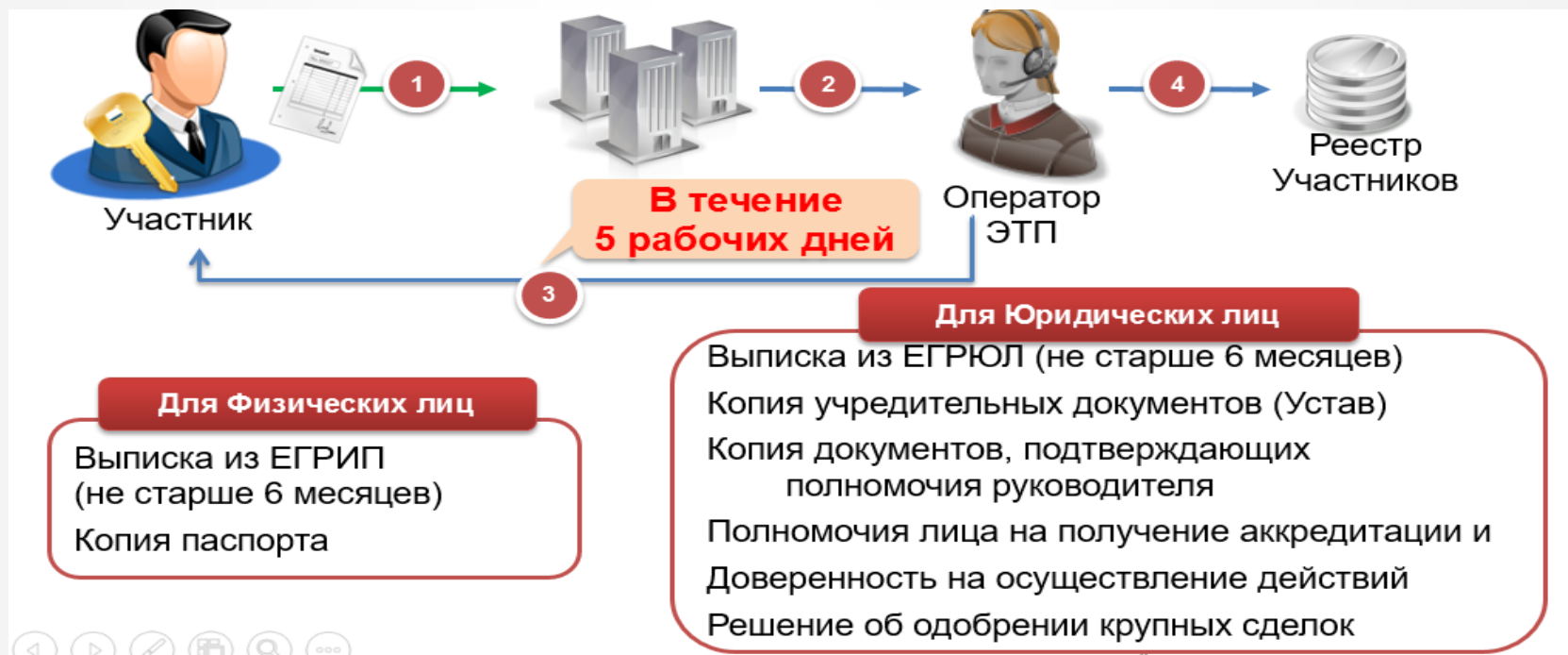
Схема аккредитации на площадке в днях: